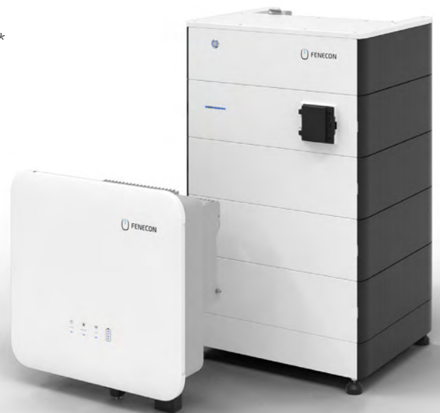
(8,4 kWh Systemvariante)