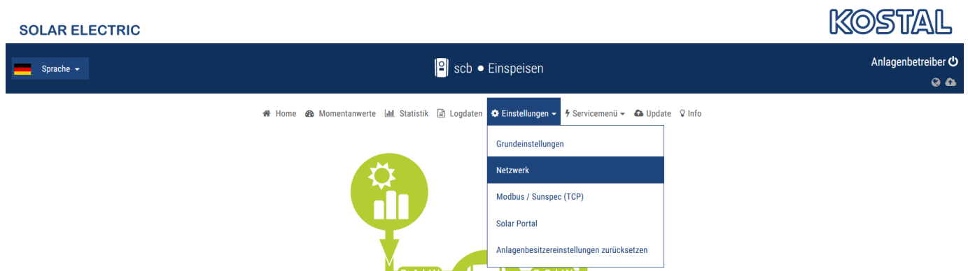
Figure 2. KOSTAL Weboberfläche – Einstellungen – Netzwerk