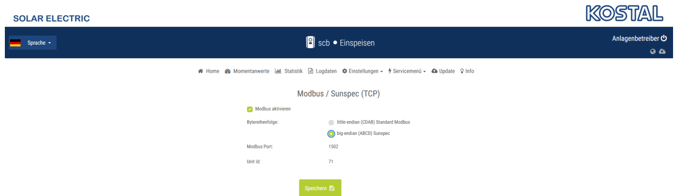
Figure 6. KOSTAL Weboberfläche – Modbus/Sunspec (TCP)