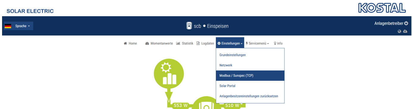
Figure 5. KOSTAL Weboberfläche – Einstellungen – Modbus